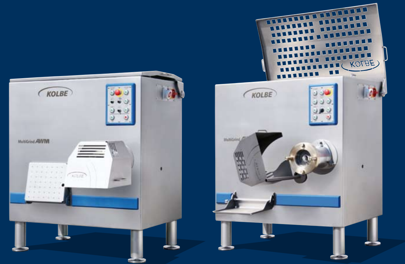
AW 130 / AW 52 AWM 130 / AWM 52