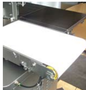
Kundengerechte Tischvariante Customized solution