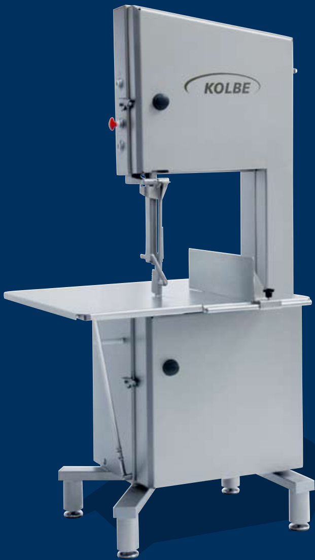
K 430 / K 430 S