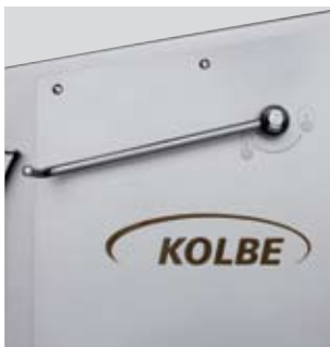
Schnellspannung Quick tension