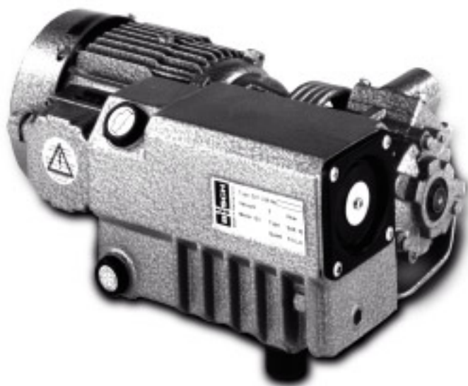
R 5 0021 B

R 5 0021 B Vakuumpumpen überzeugen durch ihre kompakte Bauweise, variabel drehbarem Saugflansch, dem bewährten Drehschieber-Prinzip und einem hohen Qualitätsstandard. Ein reichhaltiges Zubehörprogramm gewährt optimale Abstimmung auf verschiedenste Anwendungen.