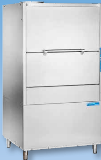
HD 80 BT