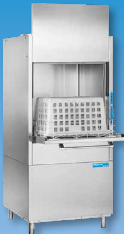
HD 60 BT