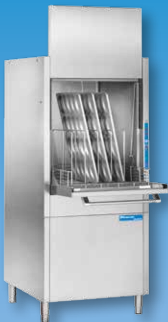
HD 40 BT