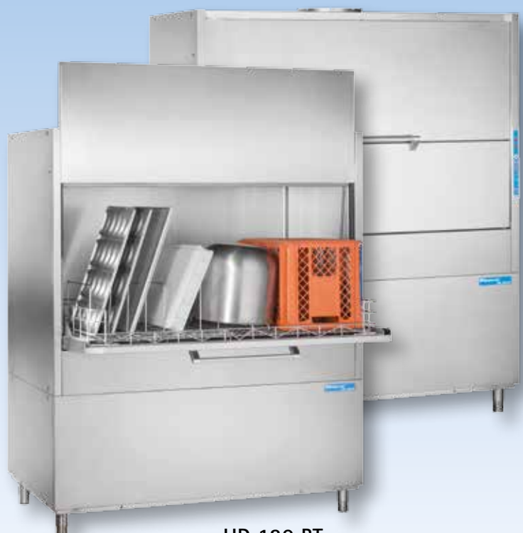
HD 130 BT